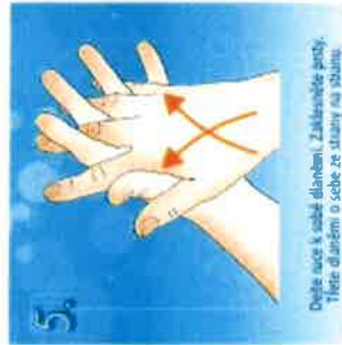
5. Děle ruce k sobě dlaněmi. Zakřetejte prsty. Třete dlaněmi o sebe ze strany na stranu.