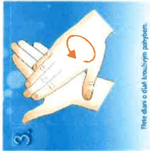
3. Třete dlaně o dlaně kruhovými pohyby.