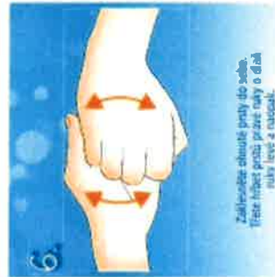
6. Zakřetejte ohnuté prsty do sebe. Třete hřbet prstů pravé ruky o dlaně levé a naopak.