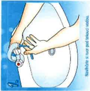
1. Navlhčete si ruce pod tekoucí vodou.