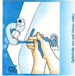
9. Opláchněte ruce pod tekoucí vodou.