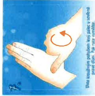
7. Dlaně každou ruku pohybem špiček prstů přetřete protěnou stranou druhé. Každou ruku vymáčkáte.