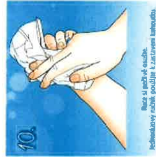
10. Ruce si mačkáte suché. Jednorázový ručník použijte k zastavení kapotrubu.