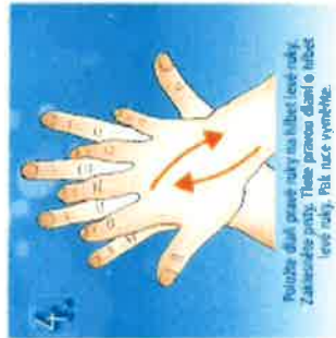
4. Použijte dlaně pravé ruky na hřbet levé ruky. Zakřetejte prsty. Třete pravou dlaní o hřbet levé ruky. Každou ruku vymáčkáte.