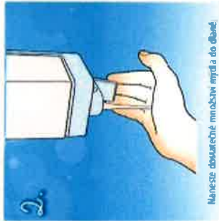
2. Naneste dostatečné množství mýdla do dlaně.