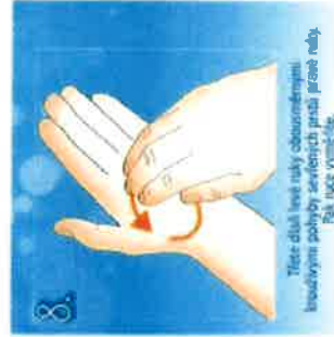
8. Třete dlaně levou rukou obousměrnými kruhovými pohyby špičkami prstů druhé ruky. Každou ruku vymáčkáte.